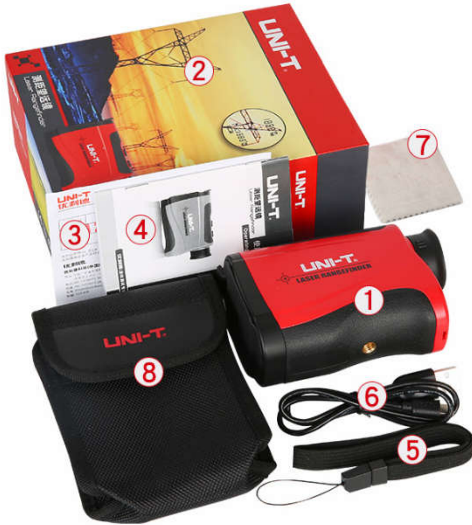
1/主机 2/彩盒 3/保修卡 4/说明书 5/挂绳 6/充电线 7/擦镜布 8/布包