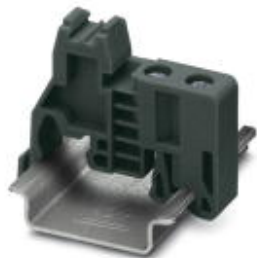
终端紧固件，安装在NS 32或NS 35/7,5 DIN导轨上

Please be informed that the data shown in this PDF Document is generated from our Online Catalog. Please find the complete data in the user's documentation. Our General Terms of Use for Downloads are valid ( http://download.phoenixcontact.com )